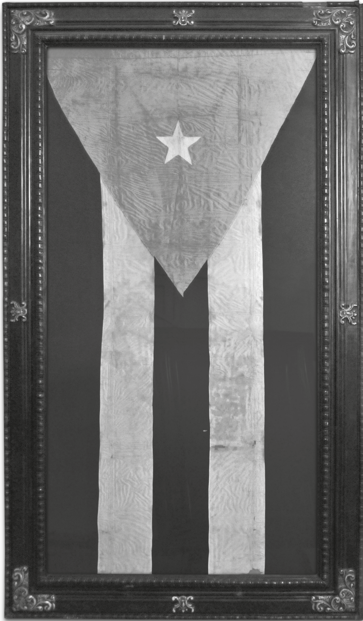
Bandera cubana enarbolada por primera vez en 1850 por Narciso López en Cárdenas, expuesta en el Museo de los Capitanes Generales en La Habana.