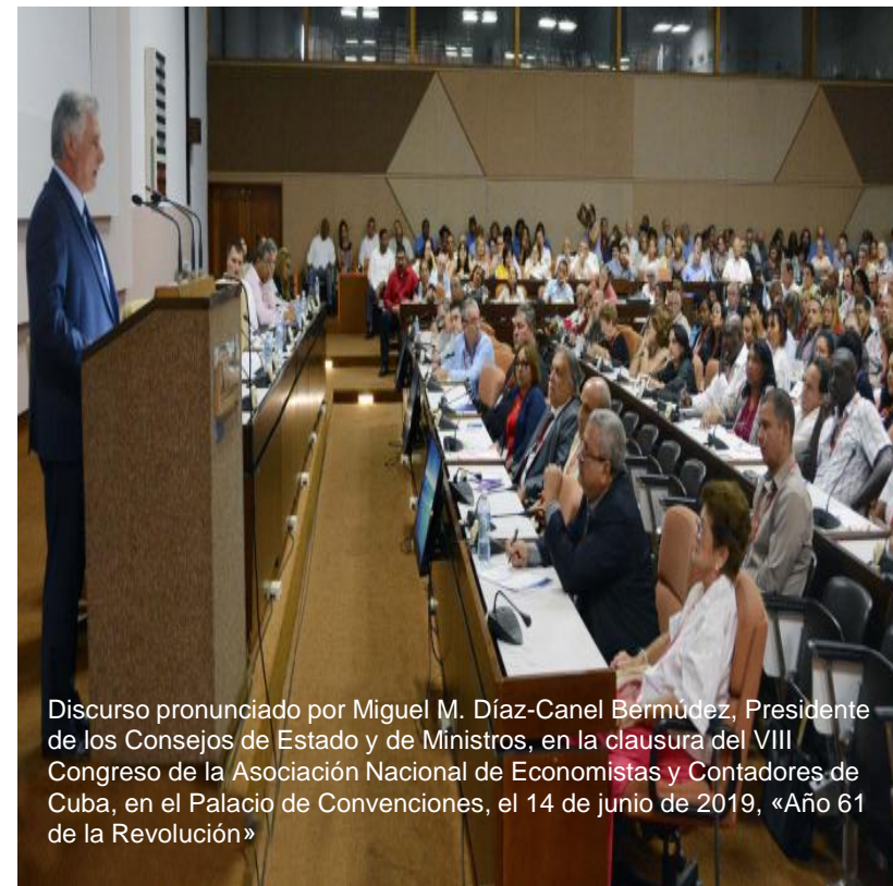
Discurso pronunciado por Miguel M. Díaz-Canel Bermúdez, Presidente de los Consejos de Estado y de Ministros, en la clausura del VIII Congreso de la Asociación Nacional de Economistas y Contadores de Cuba, en el Palacio de Convenciones, el 14 de junio de 2019, «Año 61 de la Revolución»